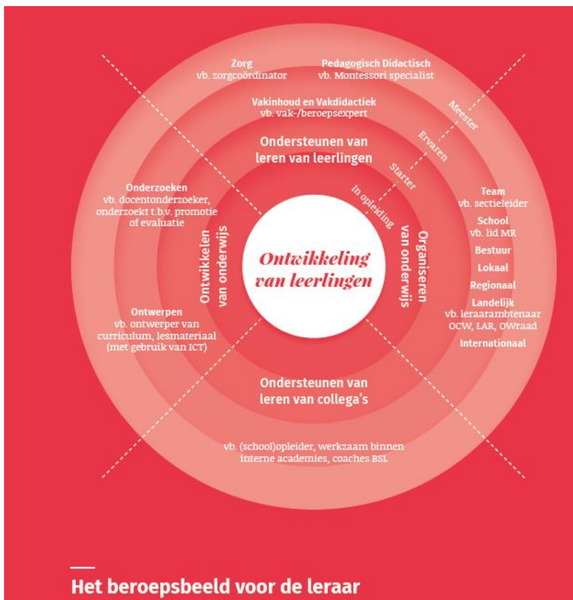
Figuur 1: Beroepsbeeld van de leraar, naar Marco Snoek et al. (2018).

De bovenstaande afbeelding “beroepsbeeld voor de leraar” schetst mogelijke ontwikkelrichtingen van de docent. De werkplekbegeleider (WB) vervult voor de aanstaande docent en startende collega’s hierin een belangrijk rol (zie afbeelding, ‘kwadrant ondersteunen van het leren van collega’s’). Deze ontwikkeling vraagt ondersteuning én kun je faseren.