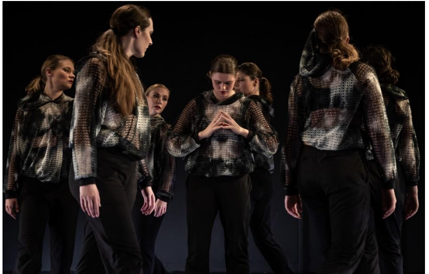
(De Dansonderneming, foto Martijn Cruyff)

Stichting De Dansonderneming maakt hedendaagse dans toegankelijk voor een breed publiek. Het gezelschap nodigt mensen uit zich te verwonderen, te reflecteren en te lachen door via dans de dagelijkse context, waaronder die van het onderwijs, in een nieuw perspectief te plaatsen. Het hoopt mensen (van jong tot oud) te motiveren om open te staan voor kunst en, wie weet, om zelf te dansen.