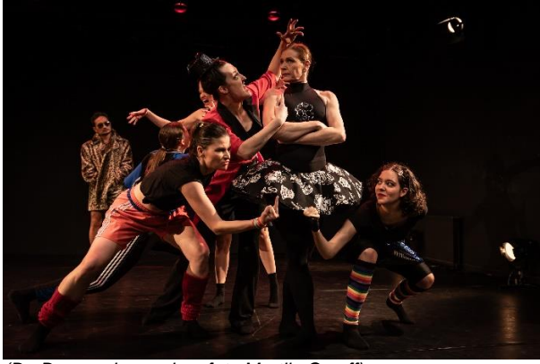
(De Dansonderneming, foto Martijn Cruyff)

Na de workshops presenteert De Dansonderneming een choreografie gemaakt voor de 'Expeditie Lerarenagenda'. Drie dansers gaan in scènes op zoek naar de professionele kwaliteit van de leraar van vandaag en morgen. Maar dé leraar bestaat niet meer: er is veelvormigheid en veelzijdigheid in het beroepsbeeld ontstaan.